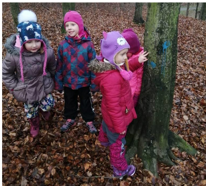
Podzimní a zimní procházky dětí ze školky do lesa jsou často spojeny s bohubilou činností – plněním krmelců, aby zvířátka