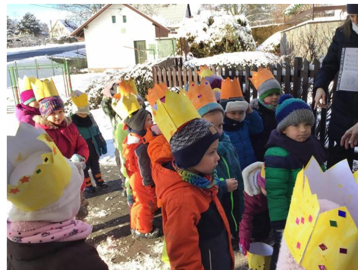
Takto přišly děti z mateřské školky v lednu koledovat k nám na obecní úřad – a krásně nám při tom zazpívaly.