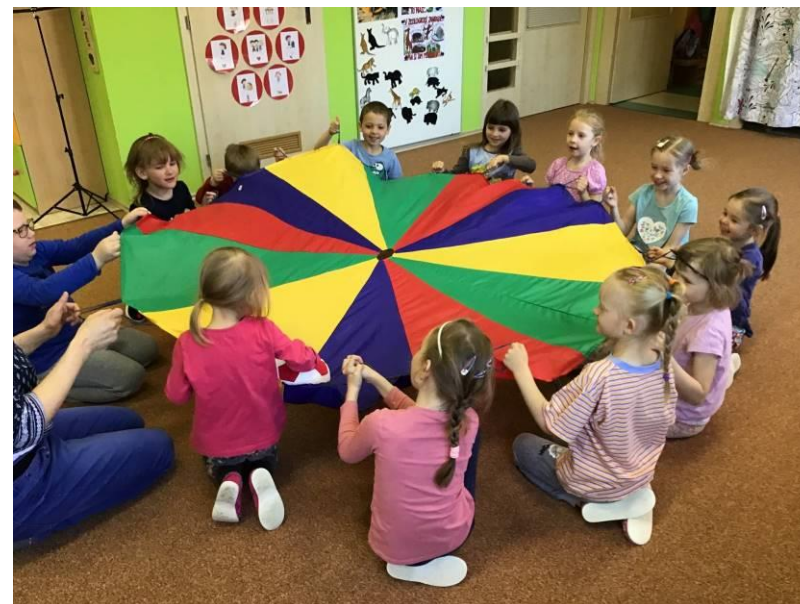
Jako první se do školky mohli vrátit předškoláci...