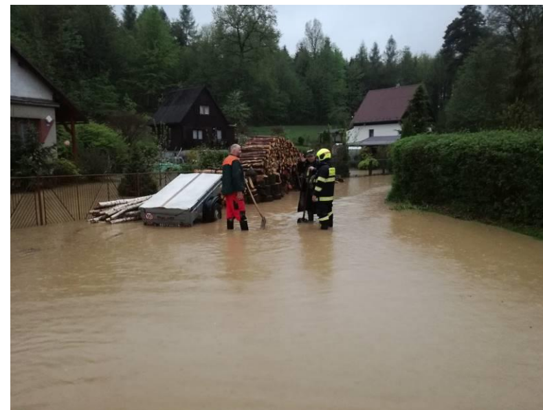
Lomy, 13. května 2021