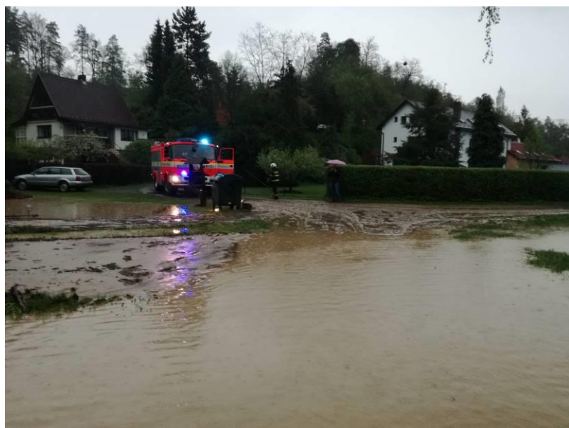
A ještě jednou povodeň v Lomech...