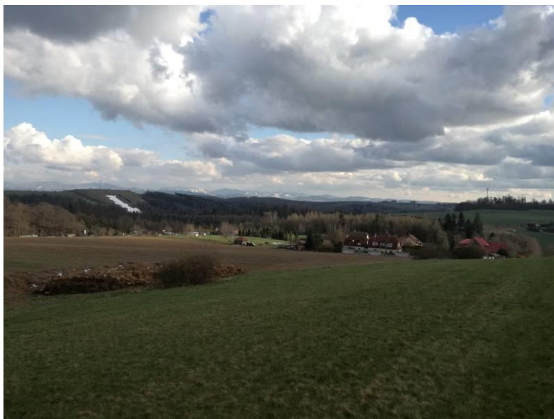
Dubnové mraky nad Zátíšim s Beskydami v pozadí.