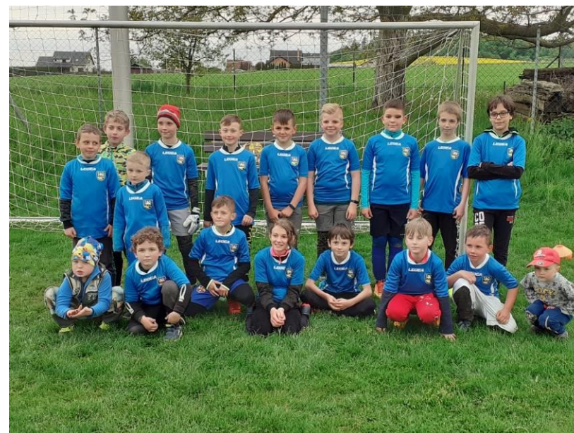
A trénovat už začali i žáci fotbalového oddílu TJ Sokol Budišovice