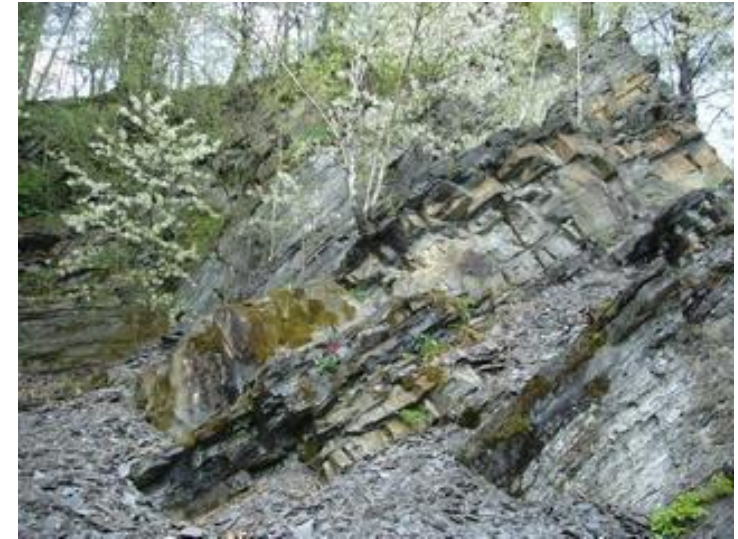
Wondruškovy lomy dnes, kdy fungují hlavně jako chatoviště.