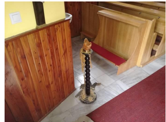
Tak nám málem vyhořela kaple...