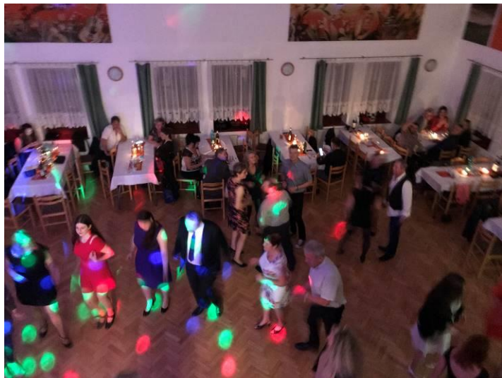
Rok utekl jako voda a doba plesů je tady - vše zahájila v polovině listopadu Krmášová.