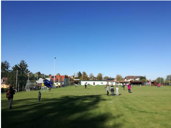
Drakiáda se mimořádně vydařila, nebe bylo bez mráčku, a dokonce foukal i vítr.