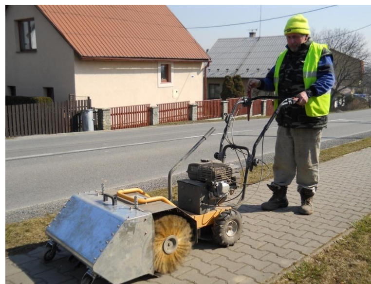
Zametací stroj pomáhá dělat naši obec hezčí.