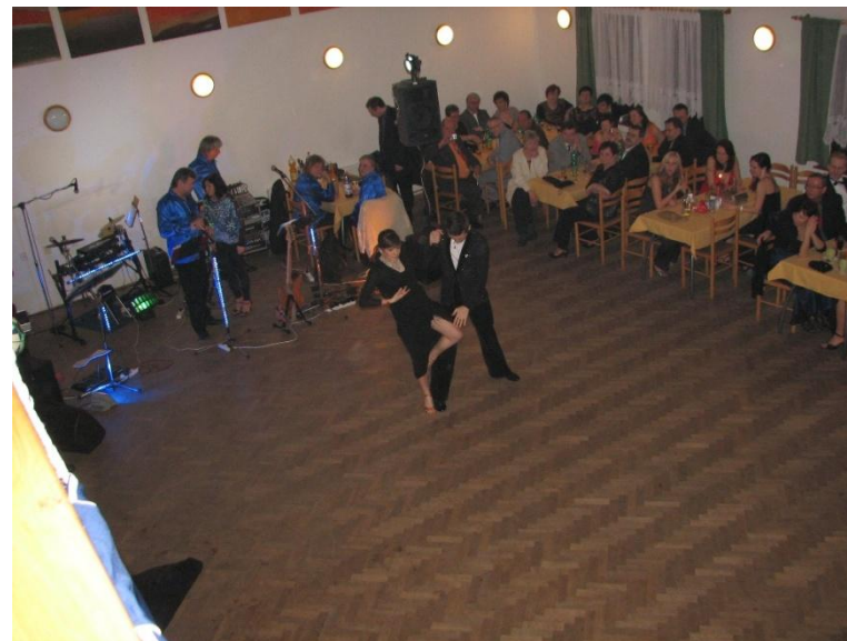
Předtančení sourozenců Vodičkových sledovali na Sokolském plese jak nadšení hosté, tak členové legendární a doslova nesmrtelné kapely Prak.