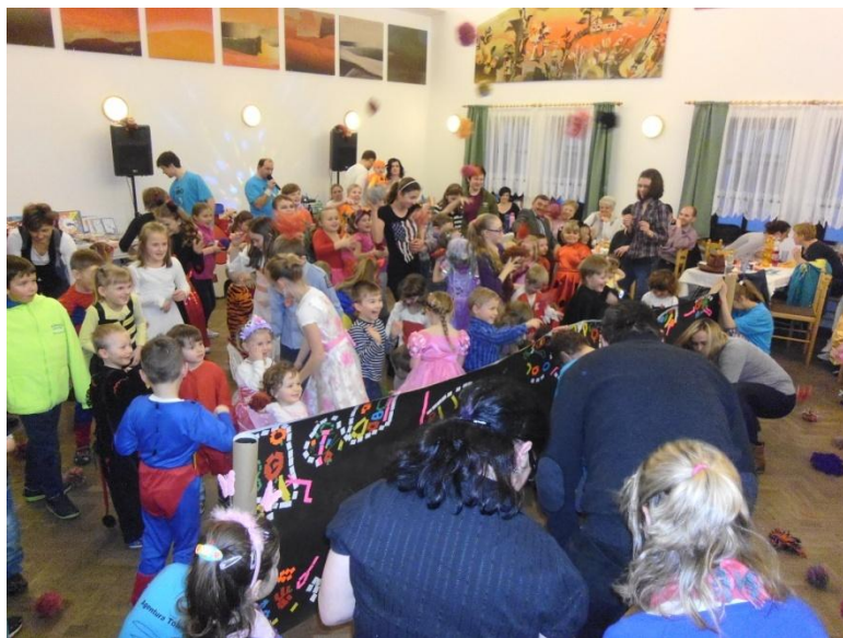
Na Maškarním plese to pořádně rozbalili všichni, děti i